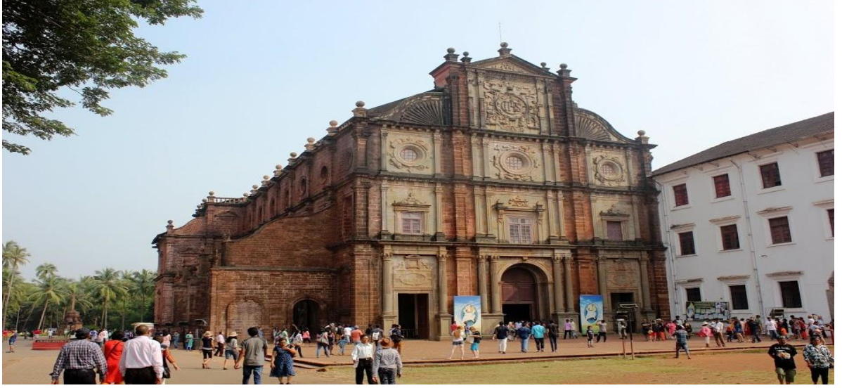
बॅसिलिकेची बाजूची रचना