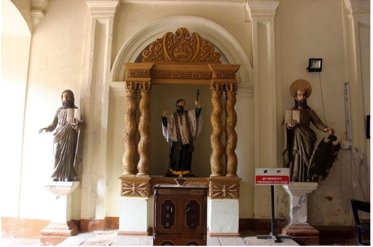
८. चर्चची वेदी आणि दोन्ही बाजूच्या उपवेदिका