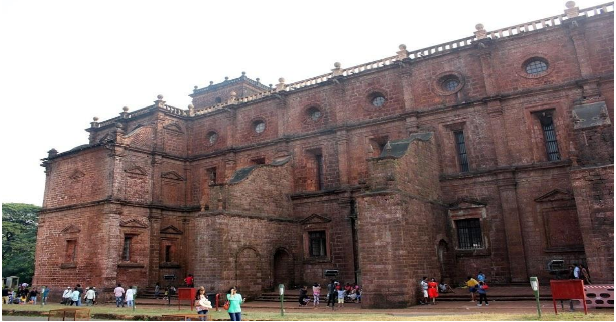
मुख्य प्रवेशद्वारावरील रचनेचं जवळून दृश्य